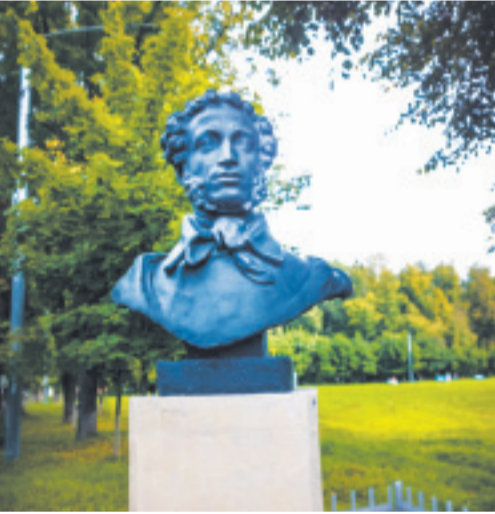
В усадьбе Большие Вязёмы

Признаться, когда мы решили, наконец, побывать в этих местах, то намеревались сначала посетить Захарово, с которым связаны самые счастливые моменты детства будущего поэта. Но слегка промахнулись и оказались в Вязёмах... Смиренно решив, что так распоряди-