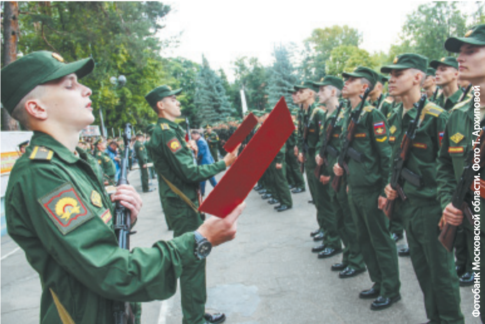
Отправка призывников в воинские части начнётся с 19 октября

Одним из главных вопросов, который волнует родителей, оказалось здоровье призывников. На «горячую» линию звонили с различными диагнозами – от бронхиальной астмы до псориаза. Со всеми этими «болячками» служба в армии категорически запрещена.