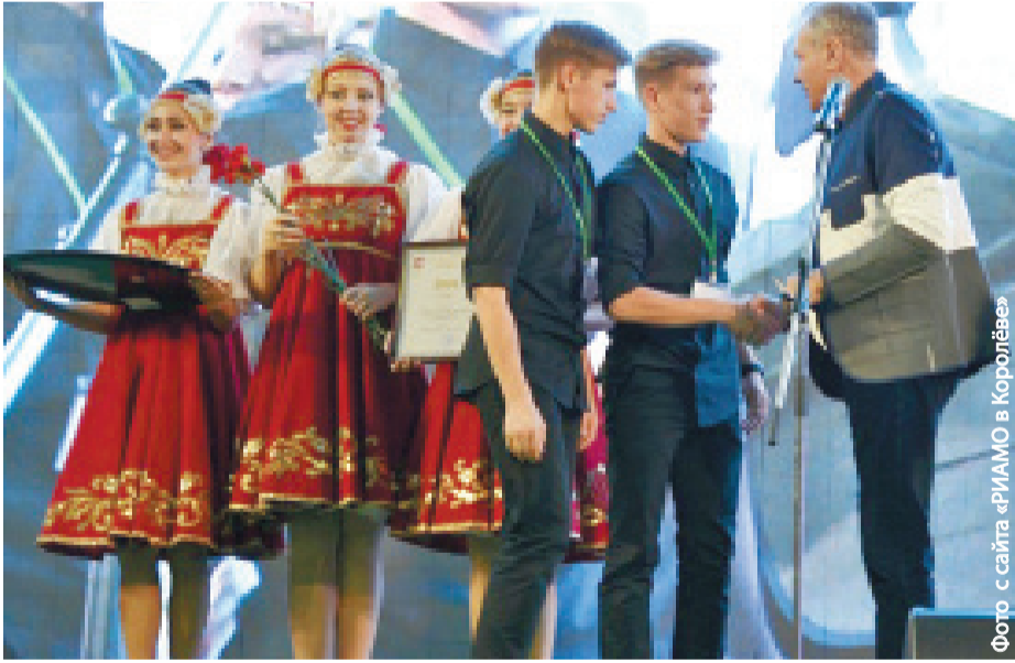
Юные королёвцы получают заслуженную награду