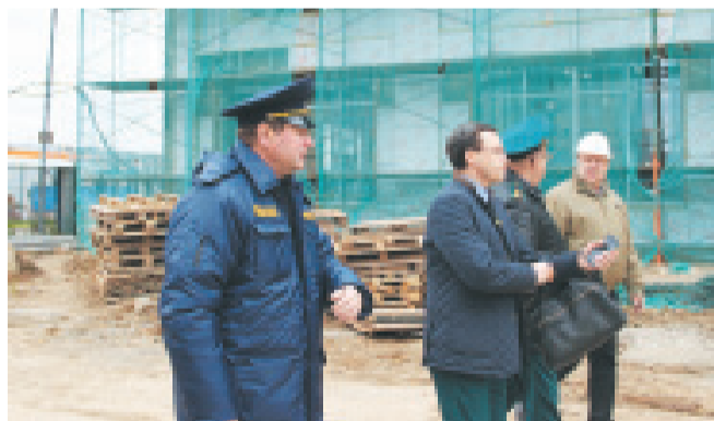
Стройки города контролируются надзорными органами

ЛЮБОЕ СТРОИТЕЛЬСТВО В ЧЕРТЕ ГОРОДА НАХОДИТСЯ ПОД ПРИСТАЛЬНЫМ ВНИМАНИЕМ РАЗЛИЧНЫХ АДМИНИСТРАТИВНЫХ СЛУЖБ.