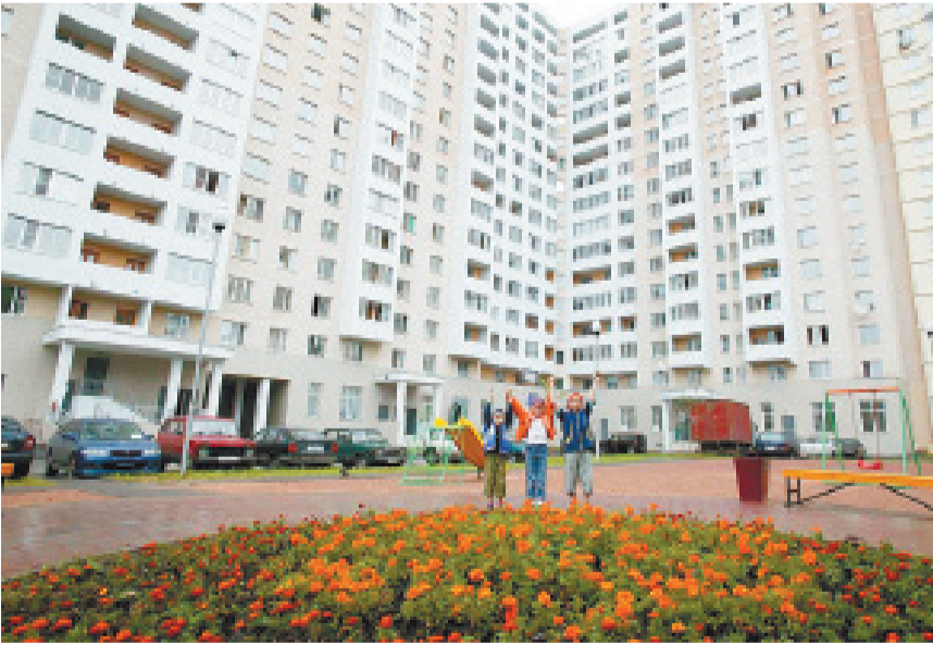
Если жители проявляют инициативу по благоустройству своих дворов, там будет чисто и уютно

Ранее в Подмоскoвьe проводился конкурс «Двор образцового содержания». Принципиальное отличие в том, что новый конкурс предполагает