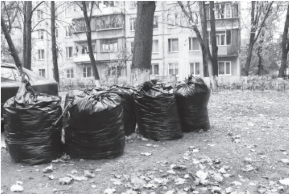
Уборка опавших листьев

Наряду с капитальным ремонтом дорог, который по плану на 2016 год уже завершился, в городе выполнялся ямочный ремонт. В сентябре в Королёве ликвидировали 307 ям на дорогах площадью более 2,8 тысяч квадратных метров. Работы велись как на дорогах, так и во дворах по заявкам жителей. Всего с начала года в ходе ямочного ремонта отремонтировано более 42,5 тысяч квадратных метров дорожного полотна.