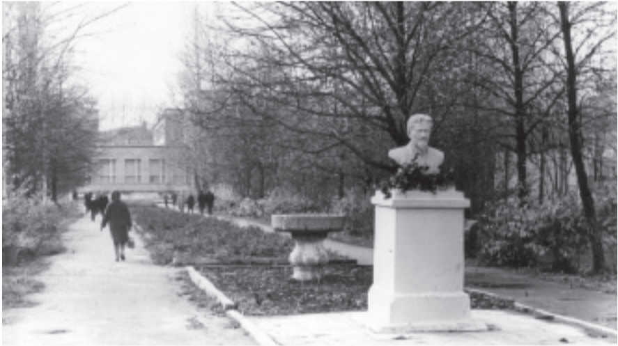
Бюст М.И. Калинин в сквере

Андрей Чермошентцев, Ольга Глаголева