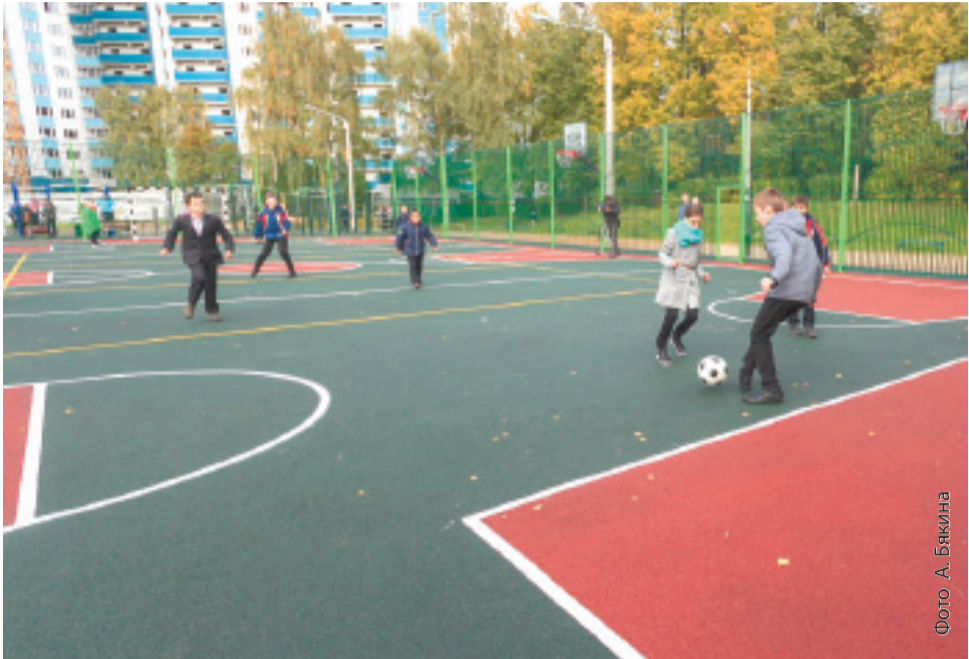
Новая спортивная площадка в школе № 22

Лариса Верешетина