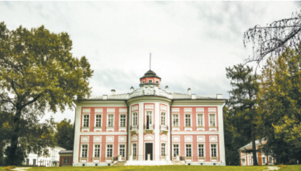
Дворец Голицыных описан в романе «Евгений Онегин»

лась судьба, мы отправились на экскурсию по усадьбе, история которой потрясает. Первые упоминания о Вязёмах можно найти ещё в духовной грамоте Ивана Калиты в 1556 году. Не отказывайтесь от экскурсовода, ведь все интереснейшие факты не отложатся в памяти в отрыве от чудесного регулярного парка, старого кладбища, уникальной звонницы, флигелей, и, конечно, самого дома, из окна которого некогда смотрел сам Наполеон. Поэтому я лишь вкратце намечу вехи, связанные с историей этого удивительного места. В конце XVI века усадьба стала вотчиной Бориса Годунова, который с размахом развернул там строительство. Именно тогда и был возведён Спасо-Преображенский храм, поражающий неподдельной стариной. Низкие своды, напоминающие кремлёвские, тёмные тихие залы. Благоговение наполняет душу вне зависимости от степени религиозности, ведь эти стены намолены целыми поколениями русских людей. К сожалению, это не помогло Вязёмам избежать потрясений. В эпоху смутного времени именно здесь располагался дворец Лжедми-