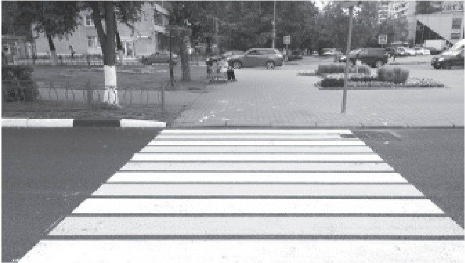
Новая разметка на проспекте Королёва

Но дороги без освещения представляют опасность как для водителей, так и для пешеходов. И работа в этом направлении также ведётся. Только в сентябре работниками МУП «Автобытдор» были заменены лампы в количестве 175 штук, а также установлены 19 новых опор.