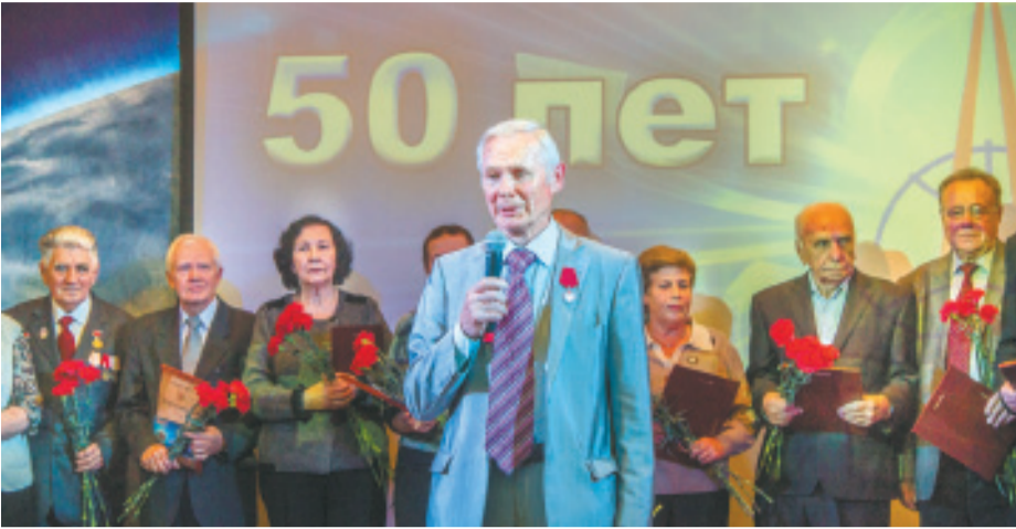
На сцене – ветераны предприятия