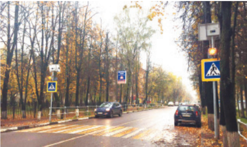
Переход у школы № 10

12 ПЕШЕХОДНЫХ ПЕРЕХОДОВ У ШКОЛ КОРОЛЁВА ПРИВЕДЕНЫ В ПОЛНОЕ СООТВЕТСТВИЕ С ТРЕБОВАНИЯМИ БЕЗОПАСНОСТИ. ОБ ЭТОМ НА ОПЕРАТИВНОМ СОВЕЩАНИИ АДМИНИСТРАЦИИ ГОРОДА В ПОНЕДЕЛЬНИК РАССКАЗАЛ НАЧАЛЬНИК УПРАВЛЕНИЯ ДОРОГ, БЛАГОУСТРОЙСТВА И ЭКОЛОГИИ ИВАН СТУДЕНИКИН.