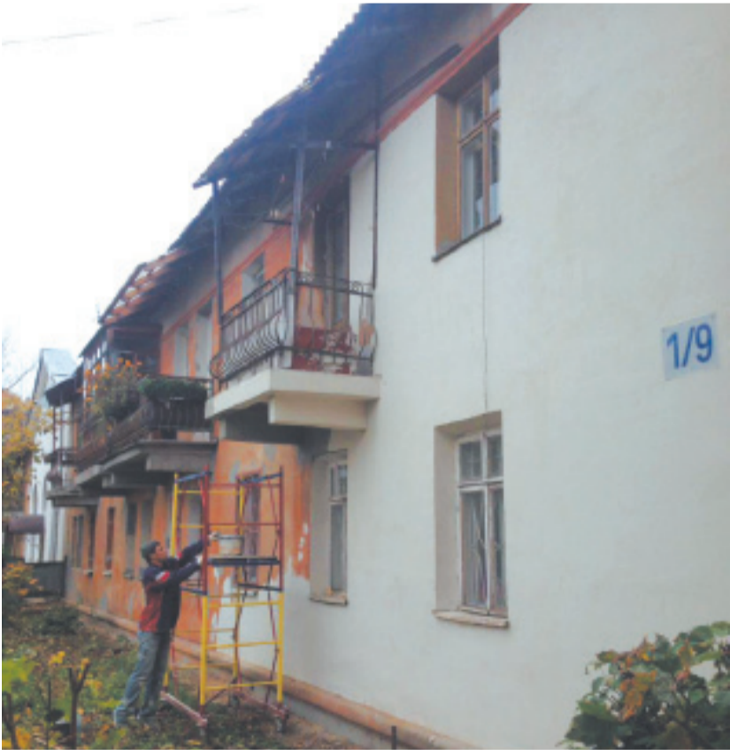
Фасадные работы в доме 1/9 по ул. Пушкина

В ГОРОДЕ ПРОДОЛЖАЕТСЯ КАПИТАЛЬНЫЙ РЕМОНТ МНОГОВАРТИРНЫХ ДОМОВ.